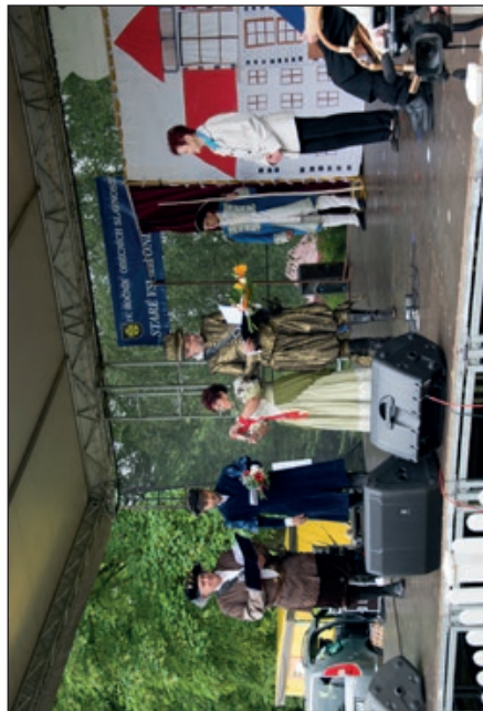
Slova vrchnosti k poddaným