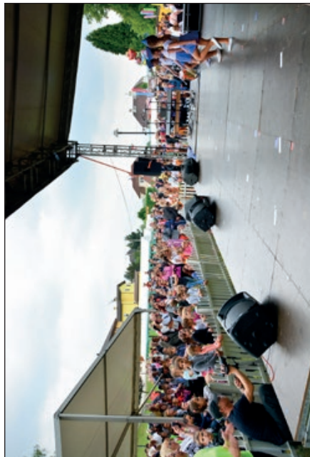
Vystoupení děti na pódiu