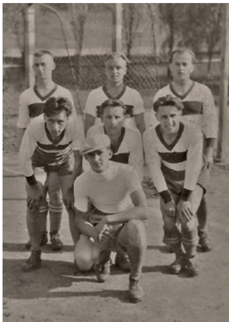
Hráči Sokola, Stará Ves 1940

činnost, později i Orlu, v činnosti zůstala pouze DTJ. Účastníci semináře přiřadili hráčům jména takto: