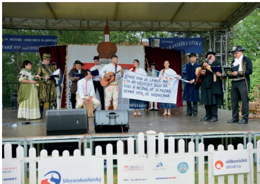
Reprodukce Staroveské hymny

Stará Ves je láska má. Ta mi vždycky sílu dá. Kdo ji nezná, ať ji pozná, Stará Ves je nádherná.