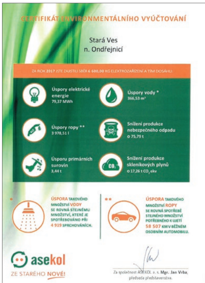
Certifikát environmentálního vyúčtování

Výsledek studie jednoznačně prokázal, že zpětný odběr elektrozařízení, i těch nejmenších,