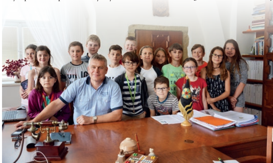
Návštěva u pana starosty