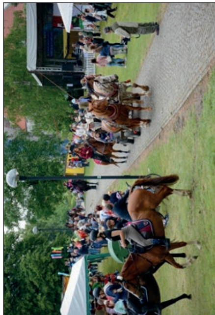
Dojezd všech účastníků Jízdy