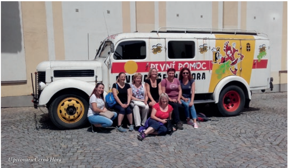
U pivovaru Černá Hora

Z Černé Hory nás autobus přemístil o kousíček dál, do Rájce-Jestřebí na tamější zámek. Po absolvování prohlídky tohoto zámku jsme se přesunuli do Brna, kde jsme byli ubytováni na internátu střední zdravotnické školy. Toto ubytování bylo velmi slušné. Zkušenější účastníci zájezdu nocovali ve dvojlůžkových pokojích, mladší spali společně.