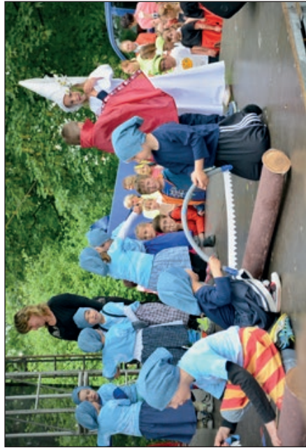
Vystoupení dětí MŠ