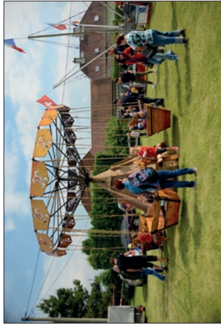
Atrakce pro děti