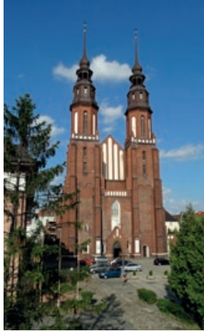
Katedrála Povýšení sv. Kříže

trvalou a významnou stopu. Město leží na řece Odře (jsou zde 2 říční přístavy). V současné době zde žije asi 128 000 obyvatel. Ve městě můžete navštívit četné restaurace (není zde tak draze jako třeba v Krakově), projet se šlapadly po rameni řeky Odry. Prohlédnout si zde můžete třeba městské muzeum nebo zdejší nejvyšší a největší kostel - katedrálu Povýšení sv. Kříže z 15. století i mnohé další kostely. Ze středověké opolské tvrze se ve městě dochovala pouze válcovitá Piastovská věž, jedna z nejstarších památek fortifikační architektury v Polsku. Za prohlídku stojí zdejší malebné náměstí s radnicí, zajímavá budova železniční stanice. A když už budete v blízkosti nádraží, tak vás Opolí „pozve“ i na svou pěší zónu, reprezentanci Krakovskou ulici.