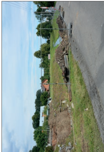
Kam se most poděl?