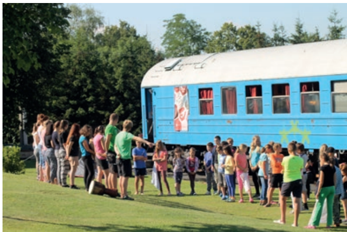
Blíží se nám opět tábory pro kluky a holky

A tak si myslím, že se patří (aspoň jednou za čas) poděkovat všem, kteří se jakýmkoliv způsobem snaží něco stavět, budovat, tvořit. Nemyslím teď jenom lidi z naší farnosti, za které jsem moc vděčný, ale všechny jakýmkoliv způsobem tvůrčí lidi z naší obce, od zastupitelstva až po ten poslední spolek.