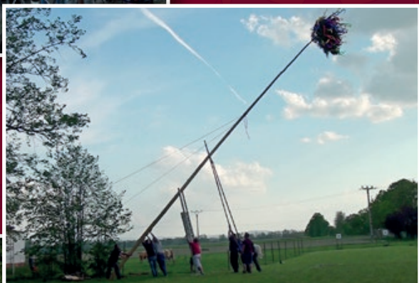
V Košatce také stavěli májku