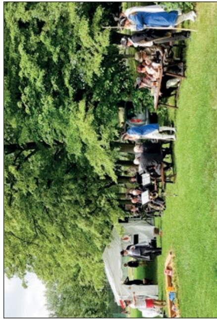
Zastavení v Košatce