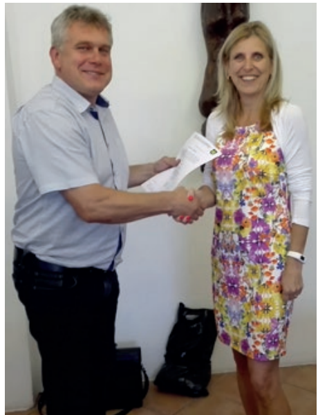
Slavnostní předání jmenovacího dekretu nové ředitelce ZŠ a MŠ

Slibovaná oprava ulice Vojenská v Košatce je hotova a oprava cesty v Březinách byla započata a její dokončení se očekává do konce prázdnin. V polovině června začala oprava lávky na ulici K Mostu s termínem dokončení do konce září. Upozorňuji, že stejný dodavatel, tedy firma STRABAG, bude opravovat také most na silnici I/58 (tzv. dálnici). Z toho důvodu bude uzavřena cesta od hasičárny k hale TJ.