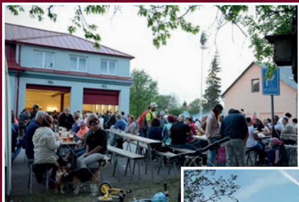
Hasiči postavili májku