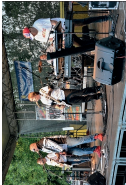
Michal David revival