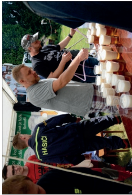
Tekutin není nikdy dost