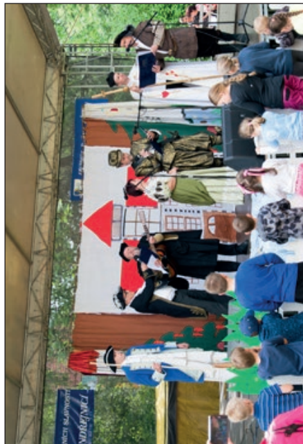
Zakončení Jízdy na pódiu