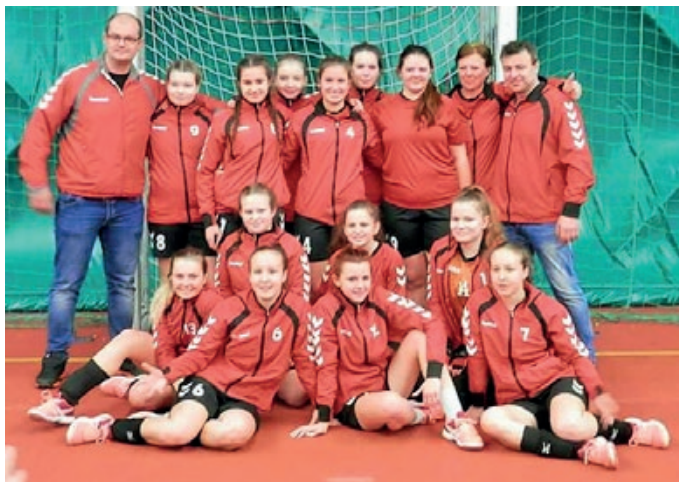
Dorostenky na finále Zimní ligy mládeže

V současné době se hrají zápasy jarní části sezóny 2017/2018. V 1. lize hrají naše hráčky nadstavbovou část o 6. - 9. místo. Hlavně se jim