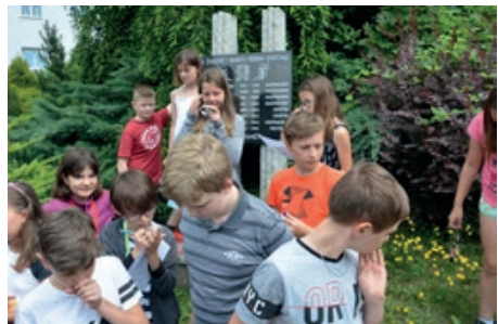
Exkurze 5. ročníku po naší obci

Tak jen některé úspěchy posledních měsíců: Poprvé v novodobé historii školy se mladším chlapcům podařilo zvítězit v okresním kole McDonald's cupu v kopané a postoupit do krajského kola. Zde naši chlapci obsadili nádherné 5. místo. Inu, být 5. v kraji je úžasné. V atletickém trojboji v sousedním Petřvaldě obsadili atleti z I. stupně krásné 3. místo. Za námi je řada sportovních utkání. V Poháru povodí Ondřejnice vybojovali žáci I. stupně 3. místo a žáci II. st. rovněž krásné 3. místo v atletice v Brušperku.