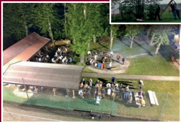
Pálení čarodějnic v Košatce