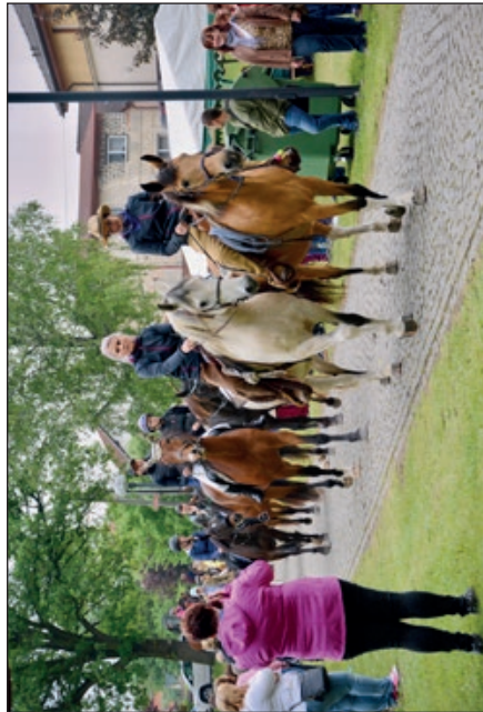
Začátek Jízdy kole obila