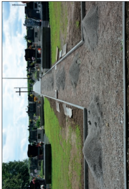
Budujeme nový chodník na hřbitově