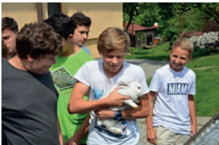
Exkurze u chovatelů drobného zvířectva