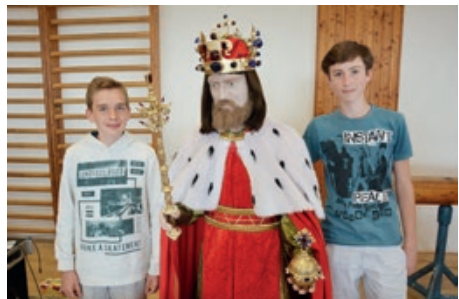
Foto s osobností