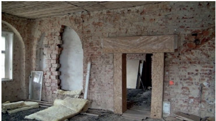
Odkrytí vnitřních omítek v 1. patře zámku v bývalé přednáškové místnosti. Nika na fotografii byla zazděna roku 1946.