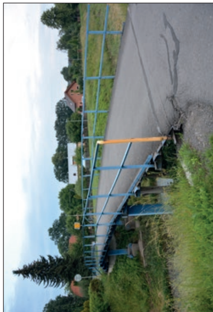
Most na Horním konci v původním stavu