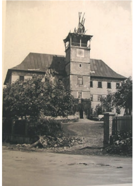
Zámek bezprostředně po konci druhé světové války