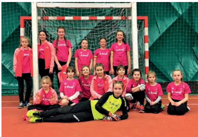
Mladší žačky na finále Zimního halového mistrovství

daří ve venkovních zápasech, vyhrály v Plzni, Žatci i v Podlázkách.